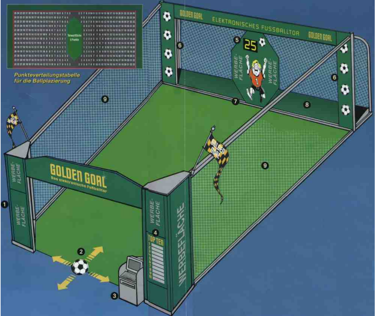
Punkteverteilungstabelle für die Ballplatzierung